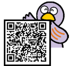
埼玉県のマスコット「コバトン」